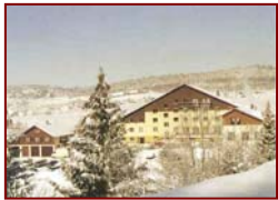
Train ou car au départ de Paris

Cadre de vie: Le Grand Chalet est implanté au pied des pistes de ski, entouré d'une nature préservée, on y pratique toutes sortes d'activités en parfaite sécurité. La maison, très confortable, (hébergement en chambres de 4 à 8 lits) dispose d'une piscine couverte et chauffée. Centre équestre récemment rénové à proximité avec un manège couvert