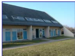
Train ou car au départ de Paris

Cadre de vie : Proche de Guérande, du Croisic, le centre, confortable, se compose de 4 pavillons sur 2 ha en partie boisés. Chambres de 5 lits, terrain de basket, 2 courts de tennis. A 300 mètres de la mer.