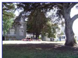
Train ou car au départ de Paris

Cadre de vie: Sur la Côte d'Amour, entre Le Croisic, La Baule et Guérande. Centre à 200 m de la plage, 500 m du port et à proximité de la Côte sauvage. Chambres de 6 lits, salles d'activités et de spectacles, bibliothèque, salle vidéo, ludothèque, aquariums.