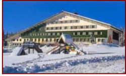
Train ou car au départ de Paris

Cadre de vie: Centre permanent très confortable, à 1150m d'altitude, à 5 km du village des Rousses, à 450 km de Paris, à 45 km de Genève, au cœur du parc naturel du Haut Jura, le Centre de Montagne "Les Jacobéys" est implanté au pied des pistes de ski alpin et au départ des pistes de ski de fond. Piscine intérieure couverte et chauffée dans le centre.