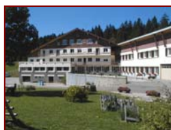
Train ou car au départ de Paris

Cadre de vie: Chalet de montagne situé à 1200 mètres d'altitude au cœur du massif jurassien. Chambres 4/6 lits tout confort ou mansardées de 8/10 lits - Piscine couverte au centre - Sauna - Mur escalade intérieur.