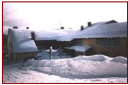
Train ou car au départ de Paris

Cadre de vie: Grande maison accueillante et chaleureuse bien adaptée à l'accueil des jeunes enfants, située en bordure de forêt, au milieu des prés, à 950 m d'altitude. 20 chambres spacieuses de 4 à 5 lits avec lavabo et rangements. Piscine couverte - Salle d'éduc-gym