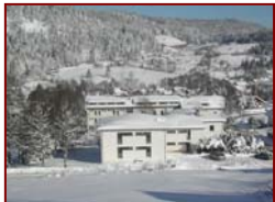
Train ou car au départ de Paris

Cadre de vie : Au pied du Col de la Schlucht et de la Route des Crêtes, à 800 mètres d'altitude, au cœur de la Vallée des Lacs. A 4 km de Gérardmer, notre village Club "Les Jonquilles" dispose de chambre de 5 lits avec sanitaires complets à proximité, d'espaces conviviaux et de nombreuses salles d'activités.