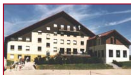
Train ou car au départ de Paris

Cadre de vie : Le Grand Chalet est implanté au pied des pistes de ski, entouré d'une nature préservée, on y pratique toutes sortes d'activités en parfaite sécurité. La maison, très confortable, (hébergement en chambres de 4 à 8 lits) dispose d'une piscine couverte et chauffée. Centre équestre récemment rénové à proximité avec un manège couvert