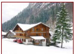
Train ou car au départ de Paris

Cadre de vie : Dans le massif du Haut - Chablais entre le Mont Blanc et le lac Léman, Morzine Avoriaz est connue pour son enneigement de qualité et son ensoleillement. Les jeunes seront hébergés dans les chalets de l'hôtellerie de collectivité selon les tranches d'âges et affinités annoncées, en chambres de 4 à 8 lits avec sanitaires complets dans chaque chambre ou à l'étage. Salle de restauration et d'activités, vidéo sur chaque centre et local à ski chauffé.