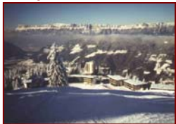
Train ou car au départ de Paris

Cadre de vie : La neige à 1450 mètres d'altitude assurée (canons à neige) et l'accès direct sur les pistes !!! Le centre de Valcoline, est situé à 50 kilomètres de Grenoble et de Chambéry et à 10 kilomètres d'Allevard, petit bourg thermal. Chambres de 4 à 6 lits avec sanitaires complets et balcon privatif offrant une vue panoramique.